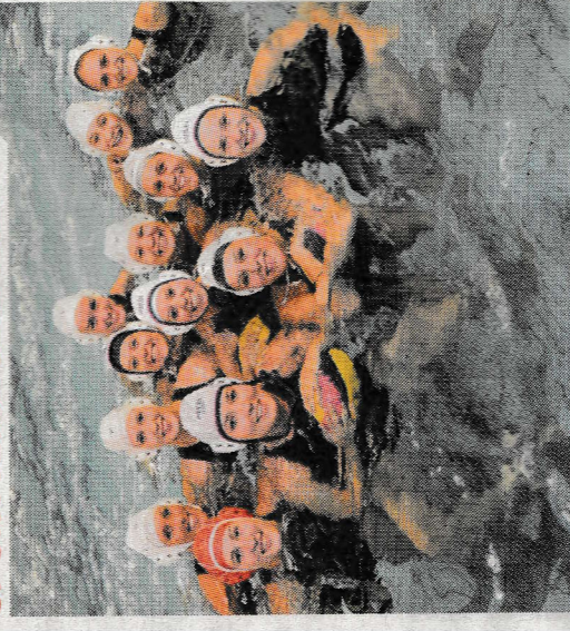
▲ ZV De Vennen, waterpolo.