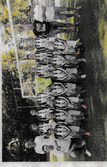
▲ Team MC1 van voetbalclub DWVC.