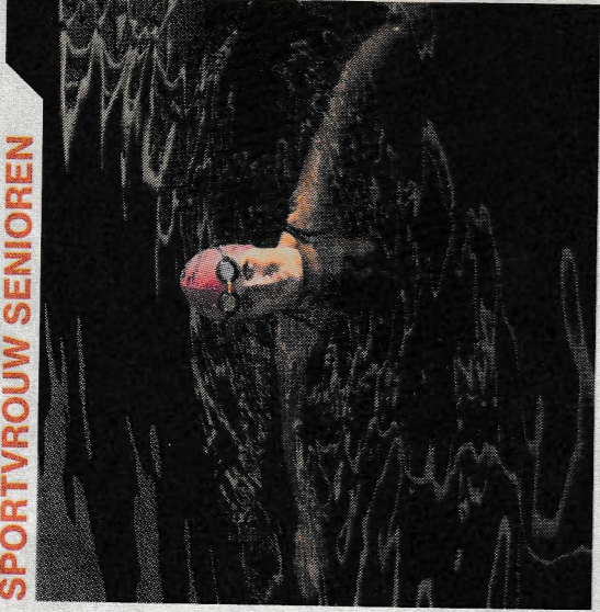
▲ Desirée Emmen, open water zwemmen.