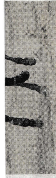
▲ Amber Rommelse, reining/western style.